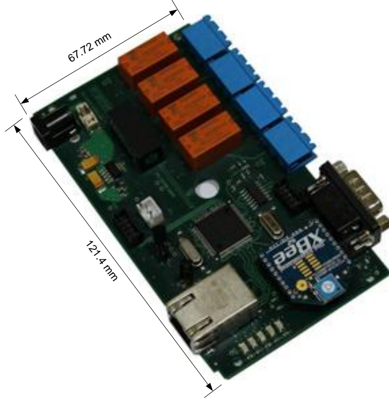
Şekil 1. UZAKRÖLE™ ET100Xbee Mekanik Özellikleri